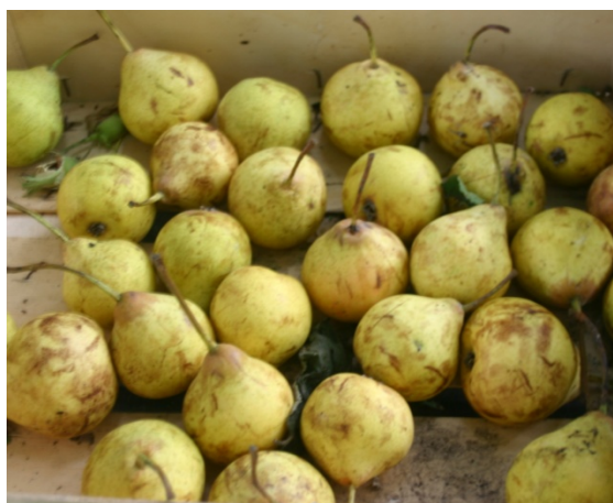
Geel maar niet buikziek

Wat groener kan ook maar dan moeten ze iets langer op staan.