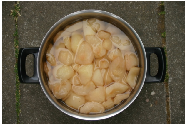
Na een poosje sudderen zijn de peertjes zacht

Warm zijn ze al heerlijk, met de typische suikerperensmaak. Zonder toevoeging kan, want de peren zijn van zichzelf zoet genoeg. Chocolade siroop of cacaopoeder maakt ze extra lekker.