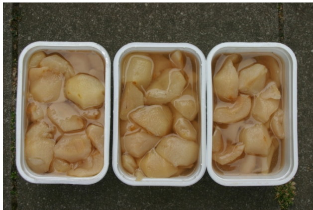
In de diepvriezer in hergebruikte margarine kuipjes

In de koelkast kunnen ze een paar dagen bewaard worden, in de diepvriezer langer dan een jaar.