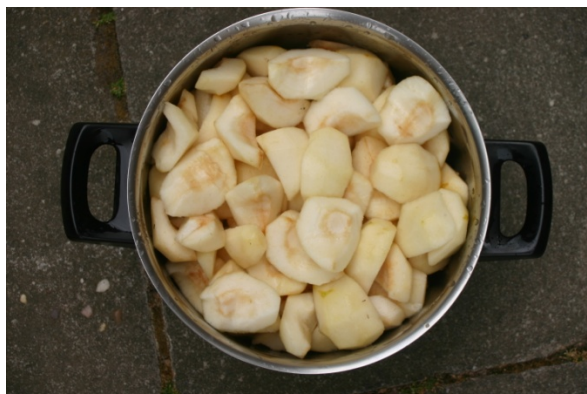
Schillen, klokhuizen en steen verwijderen

Wat groener kan ook maar dan moeten ze iets langer op staan.